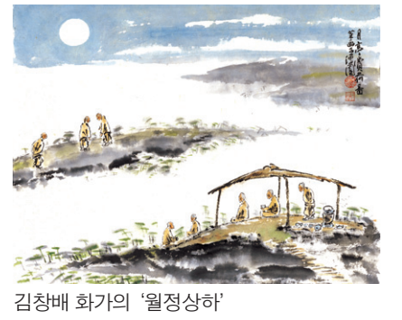
김창배 화가의 '월정상하'

또한 그림과 불교의 만남을 통한 선화를 연구하는 작가로 선묵화에 대한 8권의 화첩과 책을 엮어 냈다. 정혜숙 기자