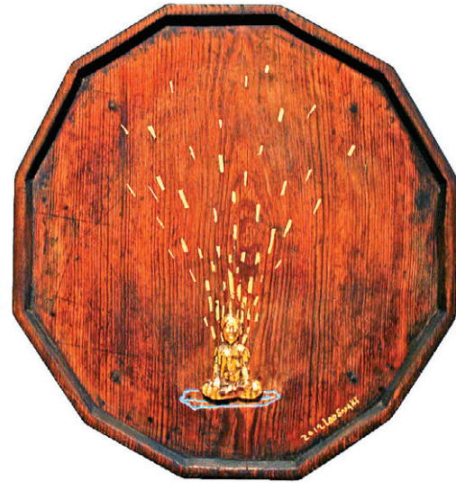
스페이스선+는 6월 9일까지 프랑스 파리 갤러리89에서 동국대 미대 출신 6명의 작품을 전시한다. 왼쪽 상단부터 시계방향으로 >박경귀 '소원을 말해봐' >김수정 '연화무늬' >이상기 '십이각 소반' >이해기 '탄생'