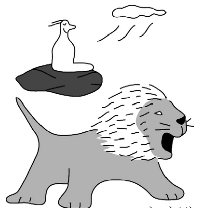
그림 · 박구원

편협한 주장을 매개로 해서, 절친한 관계에 있는 사람들이 뭉쳐서 편당(偏黨 / 片黨)을 형성할 때, 그런 편당이 많을수록 세상 안에서든 승가 안에서든 평화는 멀어져 가는 것 아닐까. 그들은 저마다 천하의 일통(一統)을 노래하면서, 그들의 방책(方策)만이 민(民)을 살피우는 일이라 말하리라. 그러나 여기 “그러한