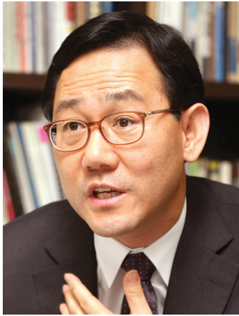
주호영 새누리당 국회의원