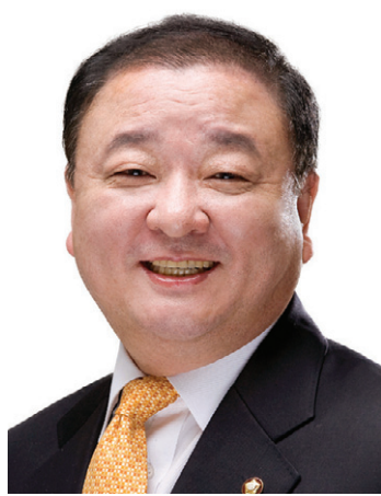
강창일 민주통합당 국회의원

평소 속초 신흥사와 평창 월정사, 인제 백담사 등 강원도 명찰을 자주 다닌다는 최 지사. 그는 평화롭고 풍요로운 마음을 부처님오신날 불자들이 서로 줄 수 있는 최고의 선물로 꼽았다. 노덕현 기자