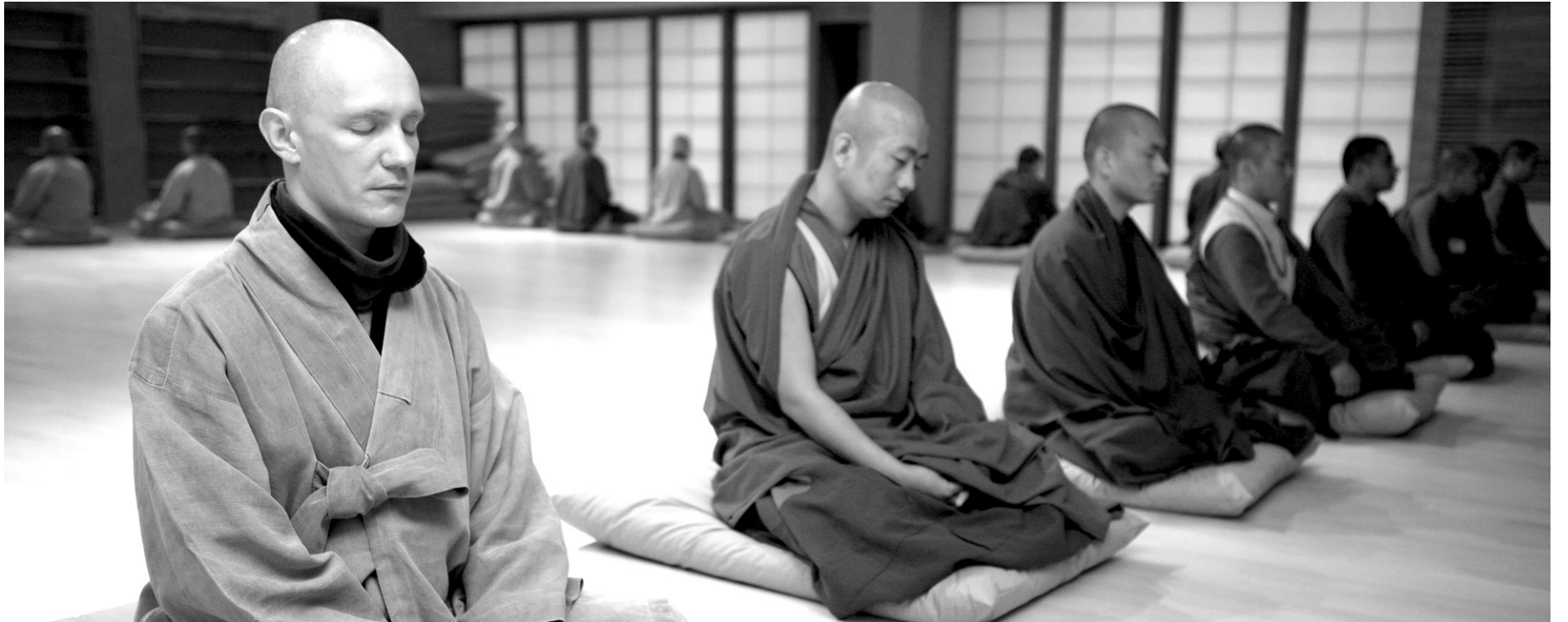
간화선 세계화를 위해서는 외국인들에게 실천 가능한 프로그램 개발이 요구되고 있다. 2011년 공주 전통불교문화원에서 열린 제3회 외국인수행자포럼에서 외국인 스님들이 참선수행을 하고 있다.