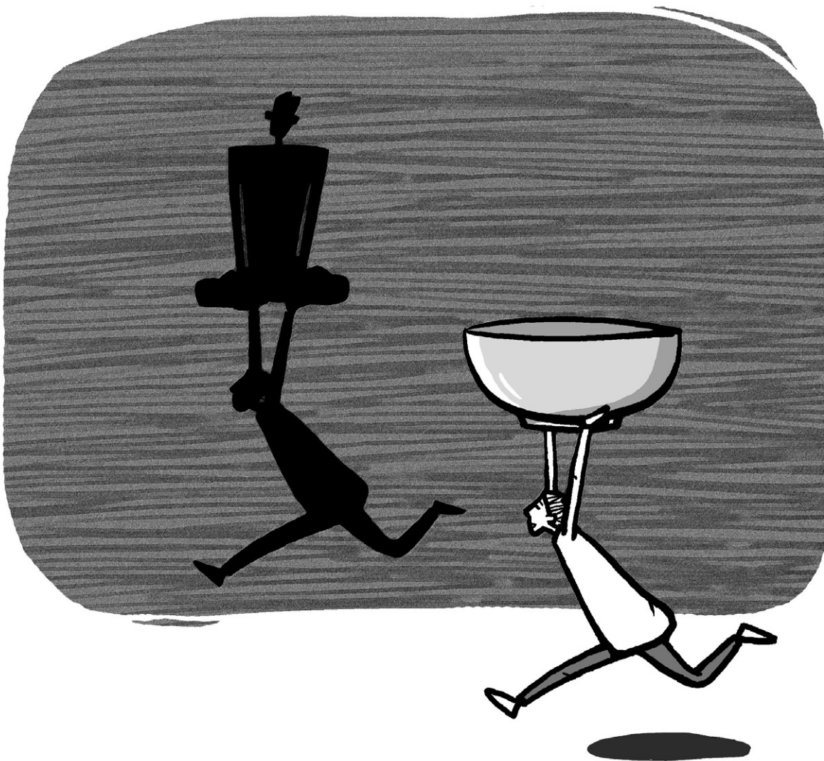
그림 · 최주현

그리고 관상이라 하는 것도 이렇습니다. 이 모든 사람들이 심상을 올바르게 가진다면 관상도 좋아질 거고, 하하하, 수상도 좋아질 거고 족상도 좋아진다 이겁니다. 심상 하나만 좋으면 잘 나고 못나고 이것을 말하는 게 아닙니다. 이 심