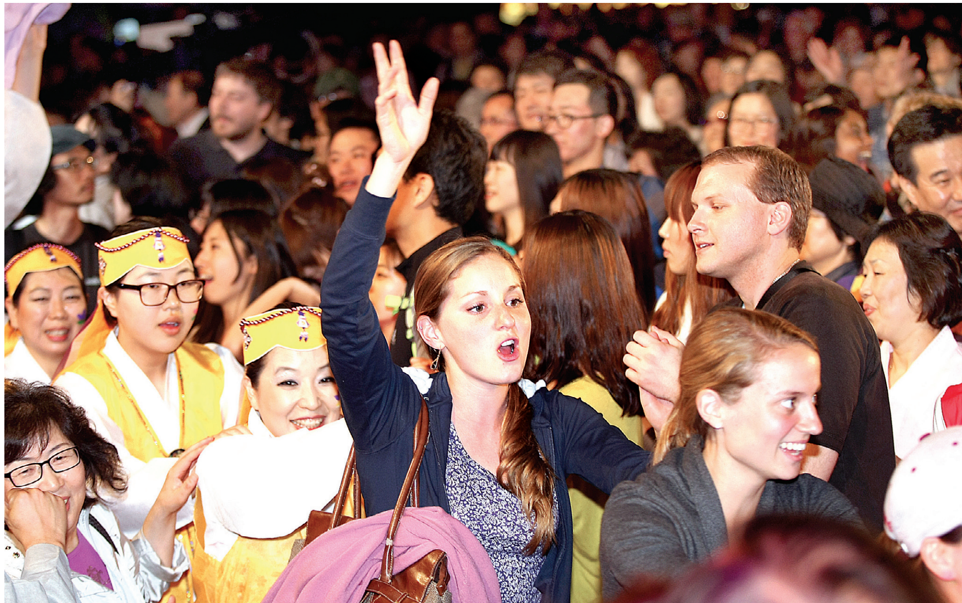
부처님오신날 봉축위원회(위원장 자승)가 5월 19일 종로일대에서 개최한 연등축제는 전세계인들이 어우러진 축제 한마당이었다. 제등행렬 이후 회향한마당에서 외국인들이 축제를 즐기고 있다.