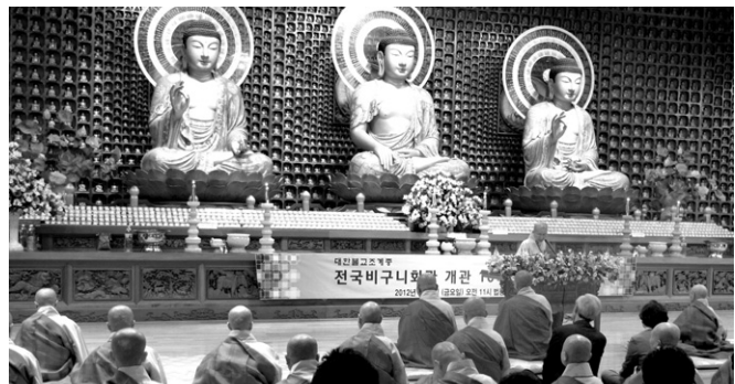
5월 4일 법통사에서 열린 전국 비구니회관 10주년 기념법회 모습