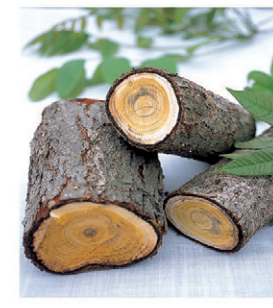
(국내산 토종 참웃나무)

우리 몸에 묻혀진 차가운 기운 즉 냉적은 각종질환 특히 여성질환을 유발하며 만성소화장애, 비만의 중요한 원인이 된다. 특히 복부비만과 하체비만, 여성의 생리통 냉대하 등의 경우 아랫배를 따뜻하게 하여 하체의 순환이 잘되도록 해야 한다.