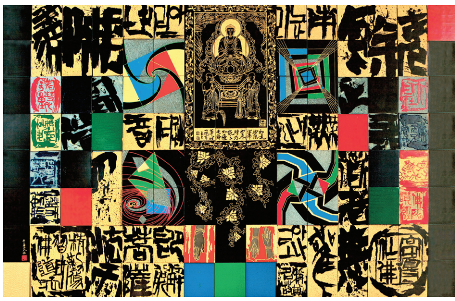
조성주 작가는 5월 24일부터 불광전을 펼친다. 이번 전시에서는 법화경 7만자를 새긴 작품을 감상할 수 있다.

〈법화경〉 총 28품 全文을 새겨 넣어 디자인한 '불광'은 본문 총 7만 1002 글자를 해서(楷書)체로 음각·양각하여 완성한 석각입체 작품이다.