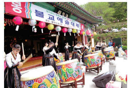
지난해 불락사 산사음악회 공연 장면

아리랑 세계유네스코 등재를 위한 '불락사'에서 들려오는 아리랑 공연이 전남 구례군 불락사 법고전(法鼓殿)에서 열린다. 5월 28일 제 27회 봉축음악제를 겸한 이번 공연은 김성녀 씨의 사회로 진행된다.