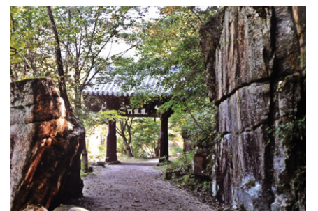
회양산 봉암사 일주문. 한불사 고희택 회장 작품

제 17회 한국불교사지학회(회장 고희택) 회원전 '산문, 참 나를 찾아서'가 5월 14일~6월 17일까지 열린다. 이번 전시는 산문을 배경으로 한 회원들의 작품 40여 점이 조계종 국제선센터 등서 네 차례에 걸쳐 진행된다.