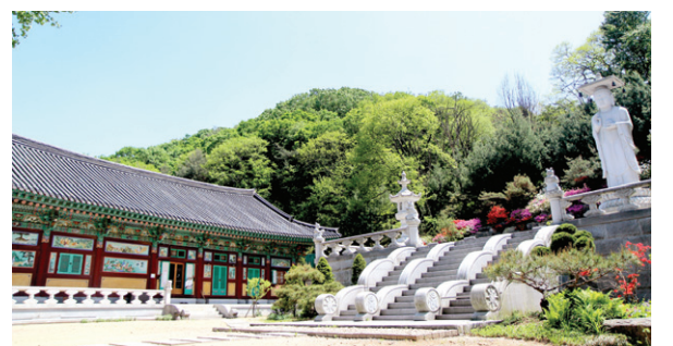
비구니 수행사찰 천개사는 사색에 잠길 수 있는 숲은 명소다.