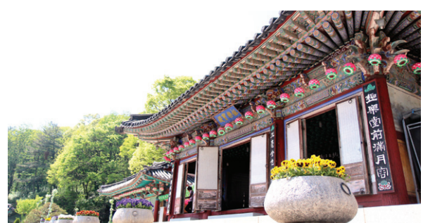
청계사는 조선 연산군때 봉은사를 대신한 선종본산이었다.