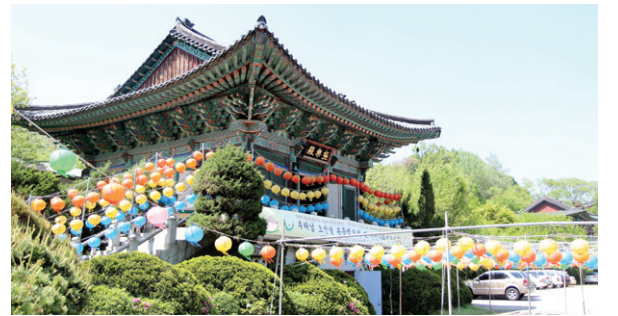
아미타 극락도량 정토사는 연꽃으로 유명하다.