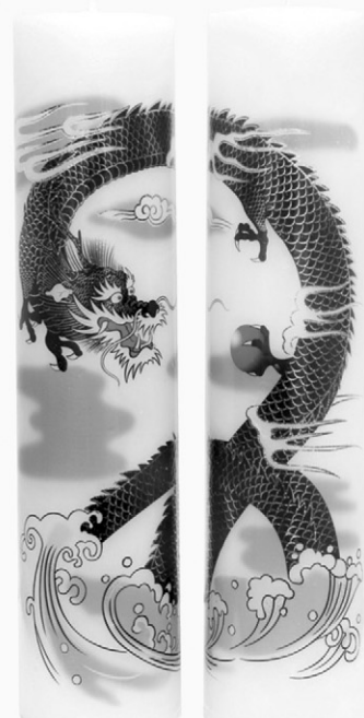
크기 7.5 x 29cm