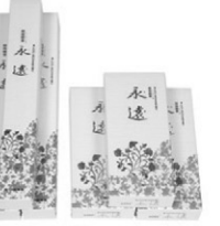
영원향 청, 단(소바라)