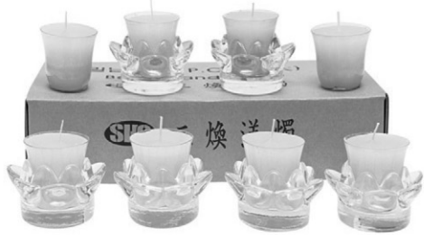
삼환양초 생산물 화재 배상 책임보험 1억원 가입