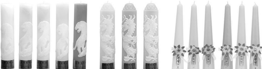
아랑 효령이 양초 연봉 원기등 7.0 x 34cm