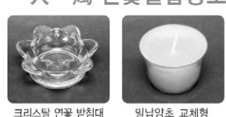
크리스탈 연꽃 받침대