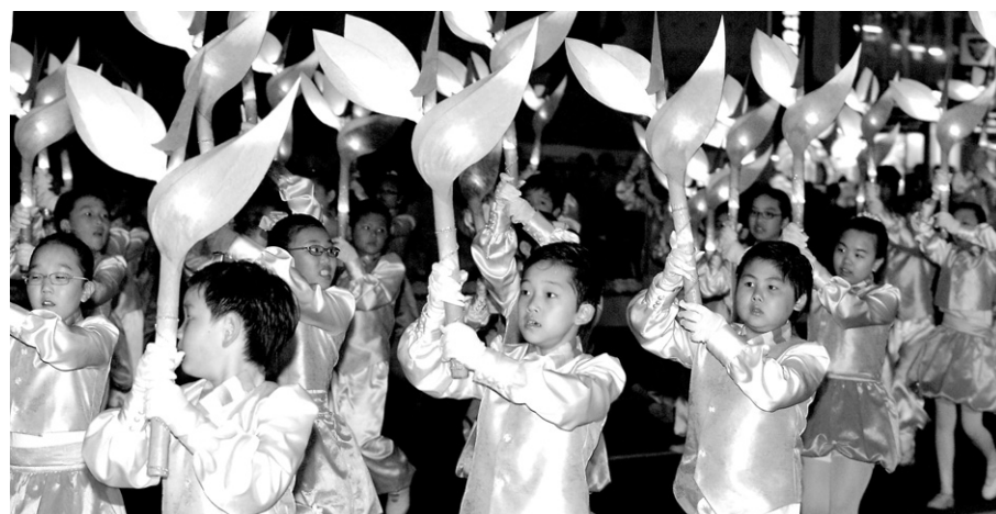
지난해 열린 부처님오신날 연등회에서 어린이들이 장엄등을 들고 행렬에 동참하고 있다. 올해에는 실컷등, 초롱등이 복원돼 행렬을 수놓을 전망이다.

20일 조계사 앞에서 열리는 불교문화마당에는 일본과 부탄불교 부스가 신설된다. 또한 이슬람국가인 방글라데시에서 불교 도라는 이유로 핍박을 받고 있는 소수민족