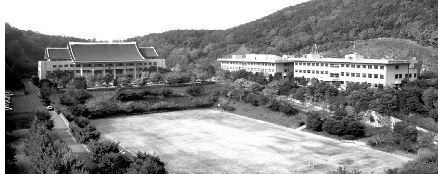
문헌사 강원 학인들이 교육을 받고 있는 모습(위)과 중앙승가대 전경(아래). 전통을 특화하고 교육은 현대화해야 한다는 목소리가 높다.