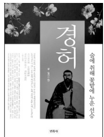
경허 일지 저자 민족사 펴냄 1만3천원

“선함과 악함이 부처와 호랑이보다 더하신 분 / 바로 경허선사이다 / 돌아가셨으니 어느 곳을 향해 떠나셨는가 / 숲에 취하여 꽃밭 속에 누우셨도다 (만공 월면)”