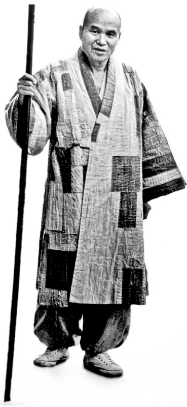
한 시대를 흔들었던 법문

〈성철 스님이 들려준 이야기 1, 2〉 〈성철 스님 행장〉 세트 원택 스님 엮음 클씨미디어 펴냄 4만5천원