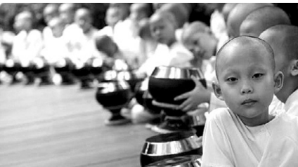
태국 방콕의 거리에서 송크란 축제 탁발을 하고 있는 사티라-담마사탄(Sathira-Dhammasathan) 불교명상센터의 여성 단기출가자들. 올해에는 5세부터 63세까지 모두 137명이 단기출가에 나섰다.