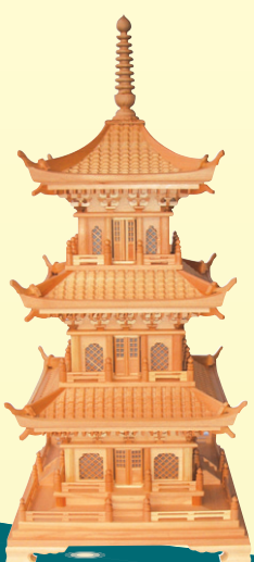
3층 목각탑 높이 85cm 가로, 세로 35cm 가격 50만원