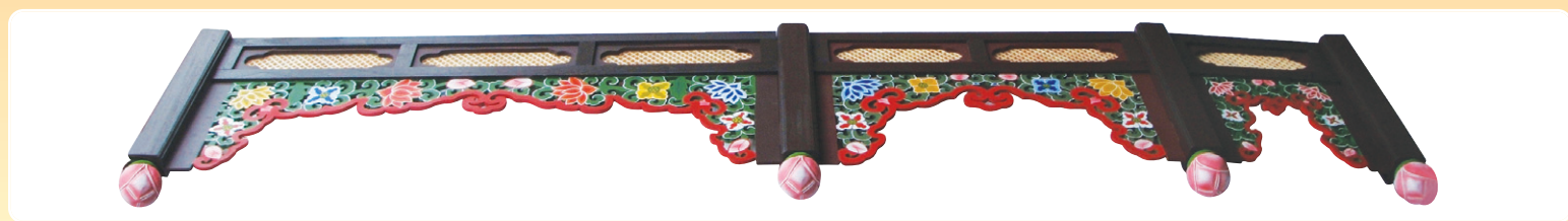
대웅전, 산신각, 포교당, 소법당 등의 천장에 누구나 간편하게 직접 조립할 수 있게 제작

전통적인 연꽃 단청과 문창살문양으로 부처님을 모시는 법당을 보다 장엄하게 설치하도록 제작하였습니다.