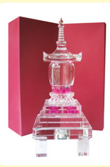
크리스탈사리탑 높이 45cm 가로, 세로 20cm 가격 35만원