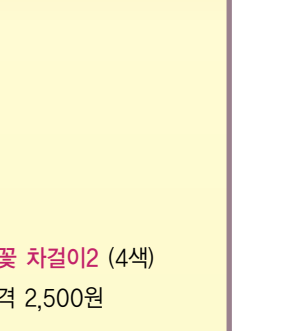
■ 연꽃 차걸이2 (4색) 가격 2,500원