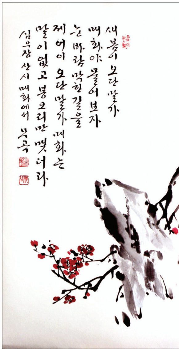
심우장산시 / 무곡 최석화 작

중생의 고뇌가 끊어 없어 여래의 서원이 무량하고, 중생이 병고에 시달리므로 보살도 아픈 것이라 했습니다. 오늘 우리가 고뇌에 차 있어 님도 고뇌의 불덩이를 이고 서 있을 것입니다. 님은 우리의 삶 어느 한 곳도 외면하지 않기 때문에, 우리 사는 이곳이 님의 땅입니다. 그곳은 바로 팔만사천 법문의 현장이기에 님의 마음으로 우리의 삶을 들여다보면 님을 만날 수 있을 것입니다. 그 믿음과 희망이 행자(行者)가 만행을 떠나는 이유이고 목적입니다.