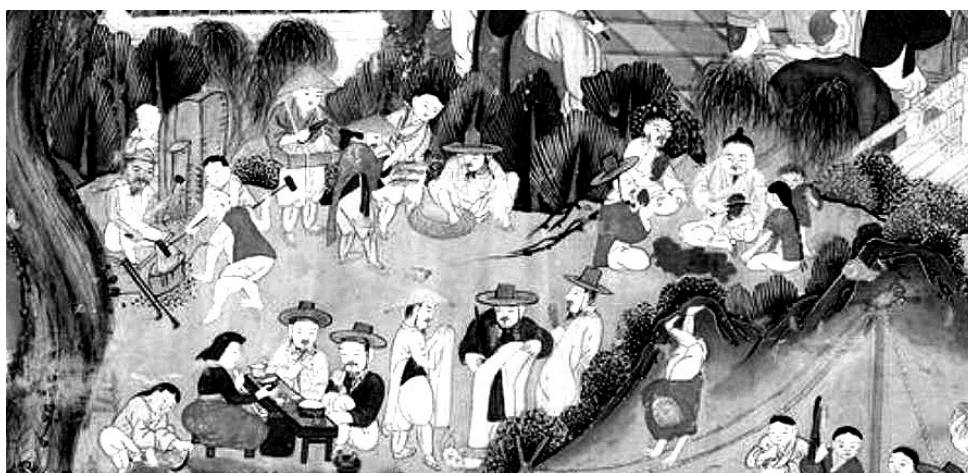
조선시대 민간 풍경을 표현한 민화. 고깔쓰고 재를 올리는 승려와 사당패 모습에서 불교음악이 왕실과 민간, 전방위에 걸쳐 영향을 줬음을 알 수 있다.