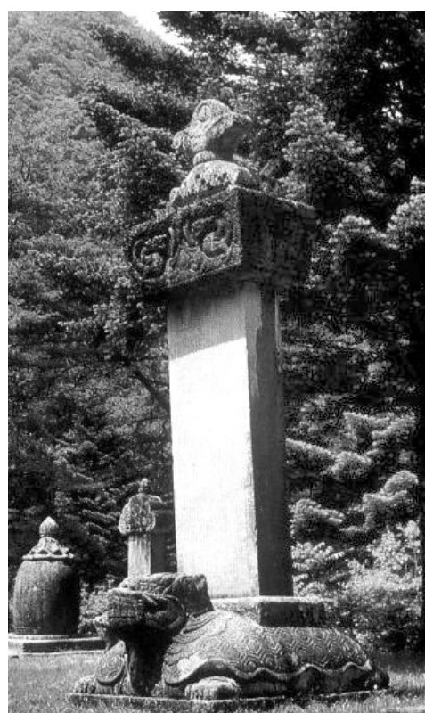
표훈사 청허 휴정선사비. 조선 중기 한문학 대가인 이정구가 썼다. 6.25동란 당시 소실돼 현재는 남아 있지 않다