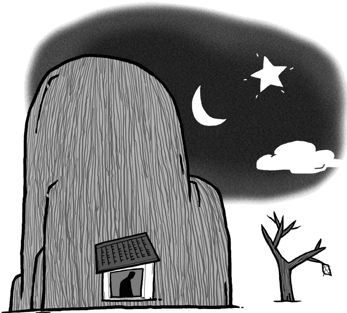
그림 · 최주현

하지 않으면, 그러니까 우리 인간이 법의 범주를 가지고 있지 않습니까? 그래서 그 범주 자체에서 다 하니까 바로 이것도 네놈이 하는 거, 이것도 네놈이 하는 거, 이것도 네놈이 하는 거, 모두가 네놈이 하는 거, 과거에 나를 끌고 다니던 나 자체가 바로 내 모습을 다시 그림 그러듯 그래서 이 세상에 내놓은 거죠. 그렇게 형상을 시켜 놓으니 모든 것은 바로 과거에 살던 인연에 의해서 주어진 내 벗들이요 친구들이요. 몸뚱이 속에 있는 그 의식들이 전부 여러분이 살던 인과로 인해서 맺어진 벗들이라고 할 수 있고, 지금도 그 벗들이 달라는 대로 주고 있습니다. 여러분이 먹는 게 아니라 그 벗들이 달라는 대로 여러분