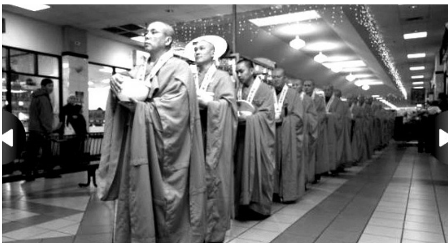
캘리포니아주 웨스트 민스터 탐 니구엔 베트남 사원은 5월 6일 제1회 부처님오신날 봉축거리행진을 개최한다. 이날 4백여명의 스님들이 참석한다.

"시 의회는 지역 사회 발전에 쏟은 베트남 불교계의 노력을 높이 평가했다"고 전제한 웨스트민스터 시의 매기 라이스(Margie Rice) 시장은 "행진 당일 400여 명의 스님과 함께 2천여 명의 불자들이 동참할 것으로 예상하고 있다"며 "웨스트민스터 도시를 가로지르는 이번 베트남 불교계의 거리 행진이 원만하게 진행될 수 있도록 당일 자동차 통행을 금지하는 등 행정