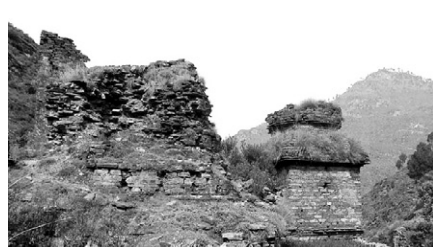
기원전 3세기 번성했던 파키스탄 스와트계곡의 불교유적

고대 불교 유적이 분포한 파키스탄 스와트 계곡의 아바사힘-치나(Abbasahib-Cheena) 유적지에 대한 관심이 집중되고 있다. 트리뷴 지는 보도에서 "스와트 계곡을 따라 거대한 불교 유적이 발견되어 왔지만 개발이란 미명 아래 훼손되고 있다"고 지적하고 "지역에서 활동하는 문화 및 환경운동가들의 의견에 파키스탄 정부가 귀를 기울여야 한다"고 강조했다.