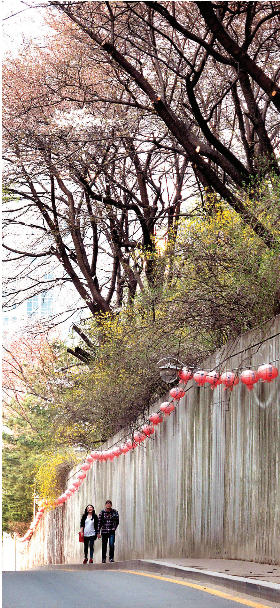
2012년 봄의 대성사 오르는 길. 두 손을 맞잡은 연인의 모습이 꽃보다 아름답다.