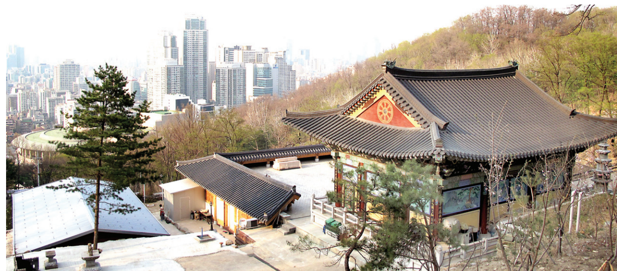
대성사 대웅전 뒤에서 바라본 강남의 풍경. 대성사 앞으로 예술의 전당과 타워팰리스를 비롯한 강남의 건물 숲이 펼쳐진다.