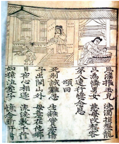
윤경5년본 부모은중경 동화사박물관 소장본

며칠 전 박물관 수장고서 오래 전에 어느 주지스님께서 퇴임하실 때 갖고 가셨다가 반환한 불서 전적류를 살펴보다가, 고본(古本) 접장본(帖裝本, 병풍처럼 펼쳐 볼 수 있게 만든 책)과 함께 겹쳐져 있는 책을 한 권 발견했다.