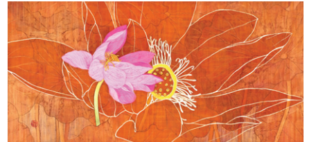
지혜(智慧)-가을 빛, 50x100cm, 장지에 채색, 석채, 백금분, 2011

연꽃에서 인생의 지혜를 배운다는 김나현 작가는 이제염오(離諸染汚), 불여악구