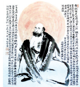
성호 스님의 달마도

성호 스님은 1978년 현암 김한영 선생 문하에서 본격적으로 그림을 배우고 수행