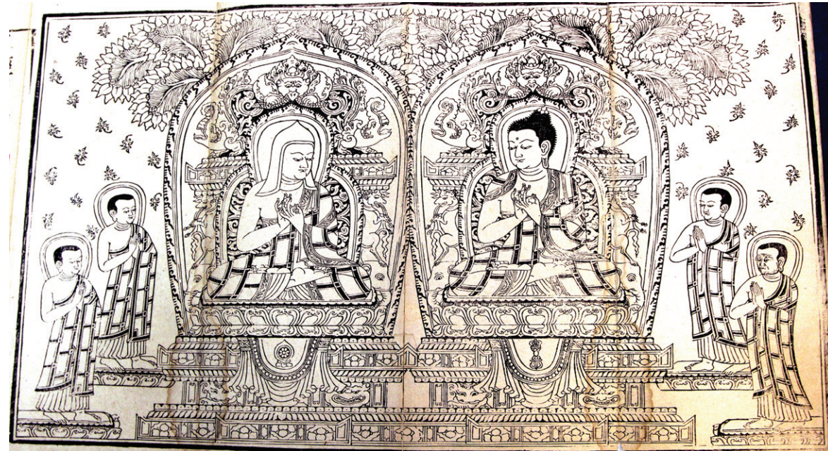
북경 수도 도서관에서 친견한 '적사경' 변상도. 송말원초(1231~1322)에 제작된 이 변상도는 진승이 그림을 그리고 진녕이 판각했으며, 티베트풍의 도상이 아름답게 펼쳐져 있다. 본존을 두광 뒷쪽에 가르라(세)가 판각된 것이 특징이다.