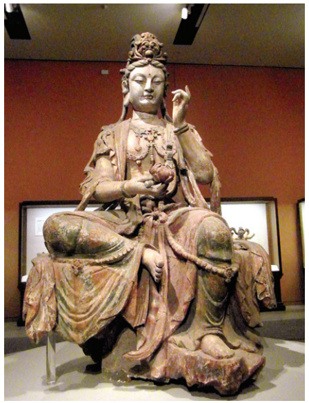
중국 국가박물관에서 전시중인 중국불상특별전에 전시된 관음상

박물관 건물은 국가도서관 부지 내에 위치하고 있다. 1921년에 축조된 건물은 과거 식당으로 사용하던 것을 리모델링해 개관한 것이다. 내부 실내디자인을 포함한 전