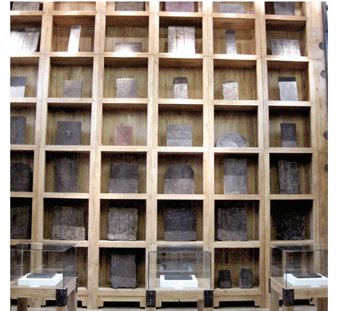
천장까지 이어지는 문진 조판박물관 진열장. 북경도서관 구관에 2009년 강심관장이 개관했다.