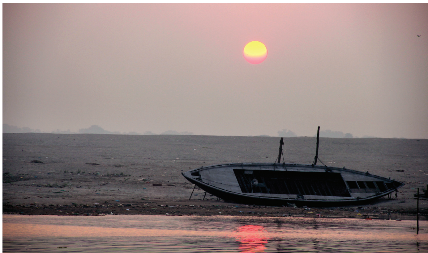
강가강의 일출과 나룻배. 부처님께서 자비를 강가강에 비유하는 설법으로 바라문 사회의 옳지 못한 관습을 일깨웠다.

현장의 '대당서역기'에 기록 바라나강 서쪽에 아쇼카왕이 세운 높이 100여척의 스투파가 있다 떠가는 꽃등 보니 붓다음성 들리는 듯 '자비의 물로 목욕하는 법 배워라'