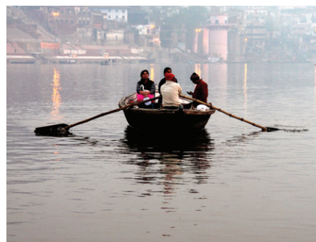
강가강을 건너는 인도인들. 힌두교는 목욕에 의한 멀리의식을 믿었다.

대도성의 동북쪽 바라나강 서쪽에 아쇼카왕이 세운 스투파가 있다. 높이 100여 척인데 앞에 돌기둥이 서 있다. 파랑기가 거울과 같으며 광택은 물을 영겨놓은 것 같