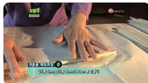
10여가지 원료를 다려낸 농축액에 적신 한지