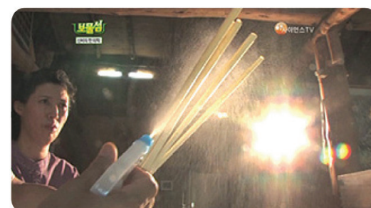
음전하여 붕으로 만들