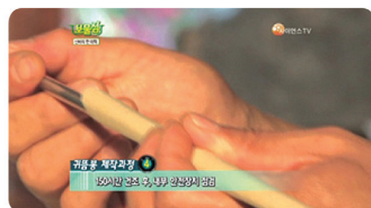
2중 안전 장치로 귀를 보호