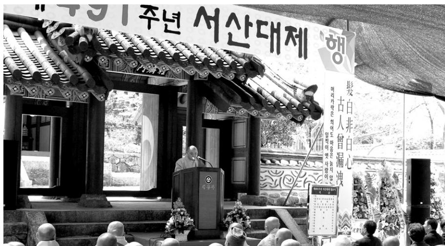
2011년 열린 제491주년 서산대제 모습. 대흥사는 매년 서산대사 제를 올리는 등 스님의 선양사업에 힘쓰고 있다.