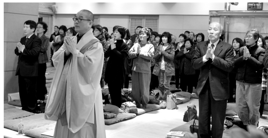
용문사 성진 스님과 거사림 회원들이 기념법회를 통해 활발한 신행활동을 다짐하고 있다.