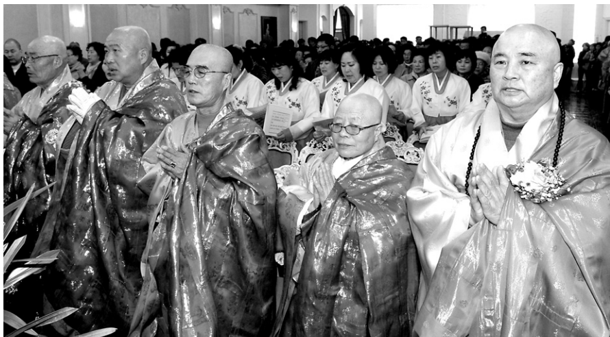
3월 25일 청암사에는 여러 종단 스님 20여 명과 500여 신도가 운집했다.