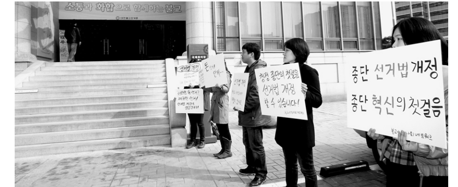
“개정선거법 통과 바랬지만...”

불교시민사회네트워크(이하 불씨넷)는 제189회 조계종 임시중앙총회 개최 전날인 3월 26일 한국 불교역사문화기념관 입구에서 기자회견을 열고, ‘종단 선거법 제개정은 자성과 쇄신을 위해 가장 절실한 과제입니다’ 제하의 성명서를 발표했다. 이같은 시민단체의 노력에도 불구하고 조계종 제189회 임시중앙총회에서는 선거법이 다루지지 않았다. 사진은 불씨넷 회원들이 총회가 열리는 한국불교역사문화기념관 앞에서 피켓을 들고 선거법 통과를 촉구하는 모습이다. 글=조동섭 기자