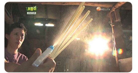
음전하여 봉으로 만들