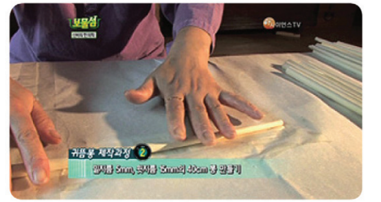
10여가지 원료를 다려낸 농축액에 적신 한지