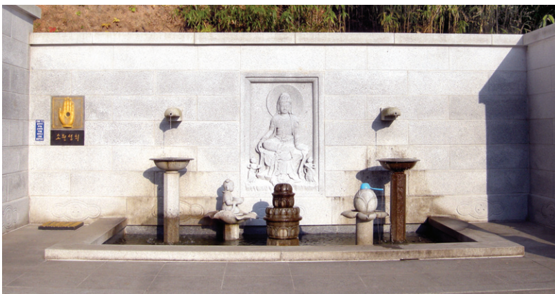
불교적 의미를 강조하기 위해 조각상을 도입하거나 조형물을 도입하는 것은 좋지만 그것이 표현되어야 할 장소성을 고려하지 않으면 상징적 의미를 얻을 수 없다.