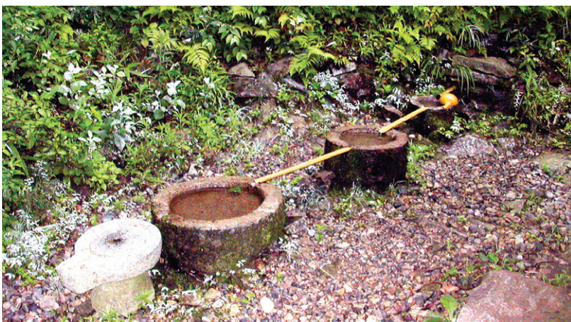
선암사 삼탕을 흉내낸 수조