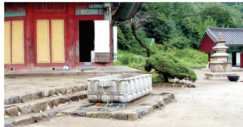
석조 용도와는 상관 없이 규모를 크게 만드는 것은 다른 요소들과의 부조화를 낳게 만드는 요인이 될 수도 있다.