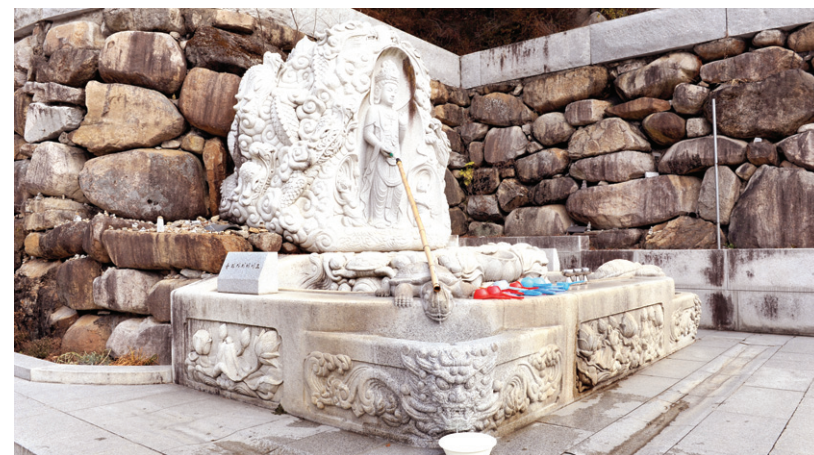
기능·의미에 부합되지 않는 지나친 장식성은 오히려 예술성을 저감하게 된다.