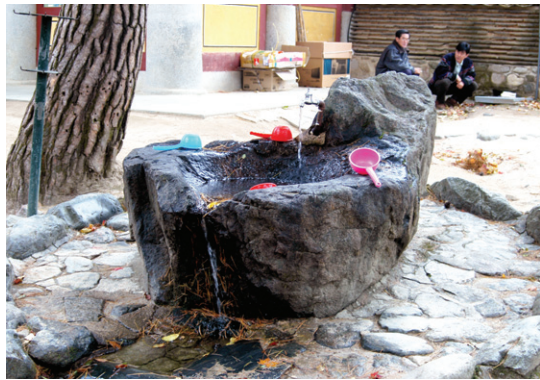
아무렇게나 놓인 물그릇은 불결한 이미지를 준다.

수조에 담긴 물을 이용하는 방법도 문제가 된다. 우리나라 사찰의 경우 수조의 물을 받아먹는 그릇이 대부분 플라스틱으로 만든 것인데, 이 플라스틱 물그릇은 색깔도 그렇지만 위생적으로도 문제가 많다. 물론 지난날 사용하던 박으로 만든 바가지의 경우 구하기도 어렵고 깨지기도 쉬워 플라스틱으로 만든 물그릇을 쓰는 것은 이해가 되지만 때가 꼬질꼬질하게