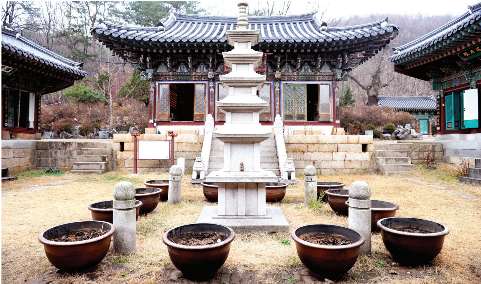
탑주위에 수조를 진열하고 꽃을 심는것은 경관을 해치는 원인이 된다.