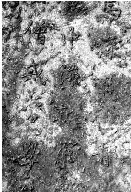
비'에 소개될 정도로 당나라에서 임직한 신라 최고의 구법승이었다"고 밝혔다.

로우 씨는 "비문 내용 분석을 통해 혜각 스님은 유식학이 성행했던 신라 석덕왕대에 선종을 배우기 위해 입당했던 구법승이었으며, 하택신회의 유일한 외국인 제자이자 정통 남종선의 계승자였다는 사실을 알 수 있었다"고 설명했다. 또, "혜각 스님은 형주 개원사(開元寺)에 육조혜능비 건립 및 하북 지역에서 남종선의 권위 확립한 당사자였으며, 최치원이 지은 '지증대사