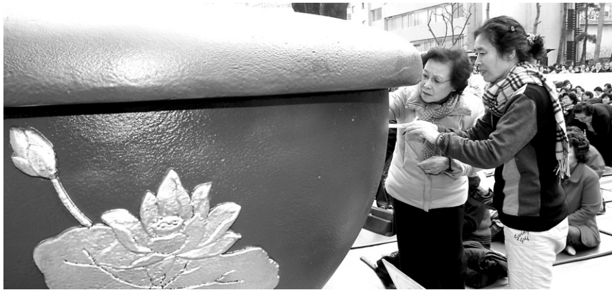
승도를 공양하는 마음