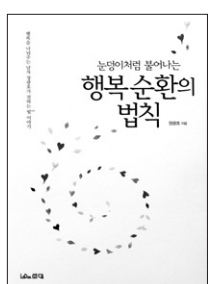
행복순환의 법칙 정광호 지음 로대 펴냄 1만2800원

저자는 이 세상은 원래 하나의 행복공동체였다고 말한다. 다 함께 더불어 살아가고 공존하는 행복공동체였지만, 인간의 이기심이 그 행복을 깨뜨렸다고 말한다. 저자는 귀땀한다.