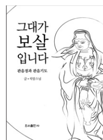
그대가 보살입니다 석암 스님 글 우리출판사 9500원