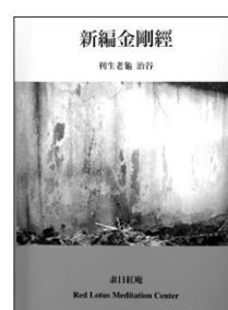
신편금강경 이생노구 지음 이일출판 펴냄 9000원

책은 구마라집의 한역본 <금강경>을 기본으로 기존의 대화들을 주제·내용별로