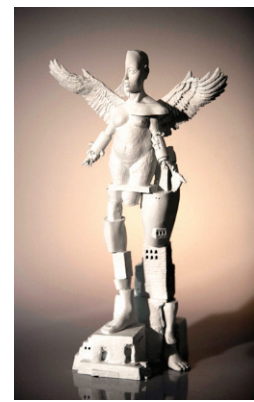
'Encounter with God', 브론즈, 2011년

과와 동국대학교원을 졸업했다. 1985년부터 수많은 전시를 통해 자신의 작품세계를 끊임없이 대중 앞에 선보여 왔다.