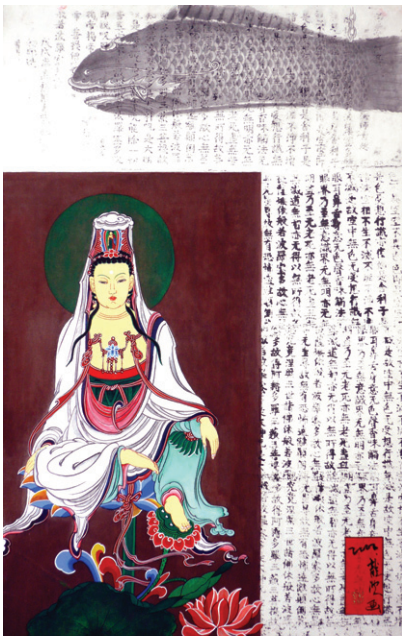
관세음의노래, 88×55cm, 한지 수묵 채색