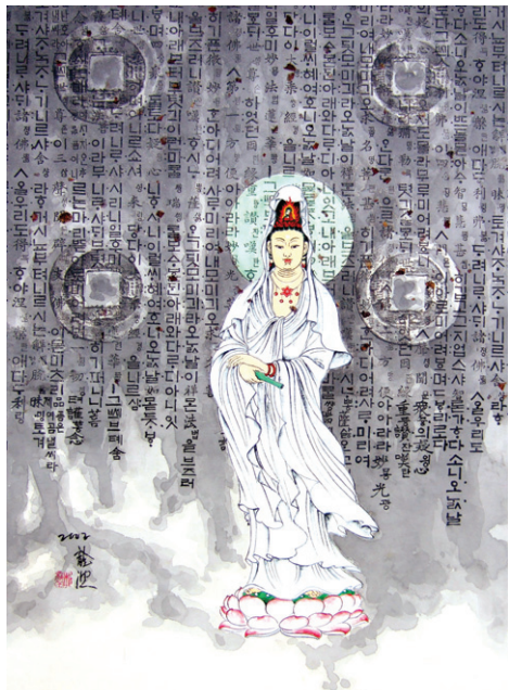
관세음의노래, 한지 수묵 채색

충남 보령에 거주하는 박주남 작가는 3-4평 남짓한 화실에서 보령의 산과 강을 무대