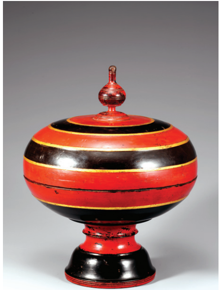
불탑의 형태를 본떠 만든 불교 공양구인 흑칠 주철 합(黑漆朱漆釜). 캄보디아 크놈펜 크메르족 19세기, 높이 35.5cm, 국립중앙박물관 소장