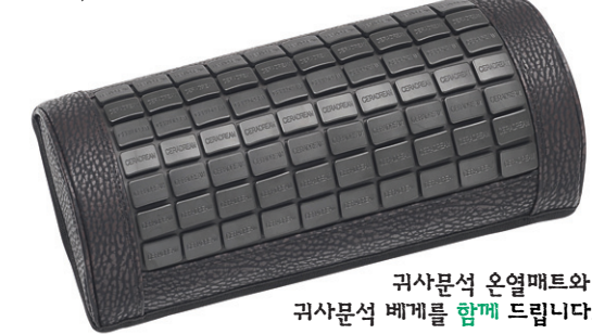
귀사문석 온열매트와 귀사문석 베개를 함께 드립니다.

귀사문석 온열매트에서는 93%이상 방출되는 원적외선이 우리몸의 피부속으로 50mm까지 침투하여 혈액순환을 촉진시켜 준다. 그리고 피하심층의 온도상승, 미세혈관의 확장, 신진대사의 강화, 부인병, 신경계 질병, 노인성질환, 어깨결림, 허리통증완화, 장속의 노폐물, 중금속 배출등에 탁월한 효과가 인정되고 있다. 또한 현대생활 주역이 시멘트 구조로 되어있어 자연적으로 지기(地氣)를 차단하여 각종 질병의 원인이 되고 있으나 귀사문석은 천연의 강력함 기(氣) 방사체이므로 자연적으로 신체에 활력소가 되어준다. 귀사문석은 항균효과 86%, 항균력이 억제력은 거의 100%이며, 냄새 제거 능력도 탁월하다.