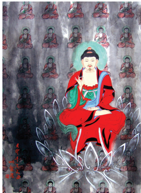
월인천강지곡, 70×55cm, 한지 수묵 채색

불교·노장사상 추구한 증진작가 '관세음의 노래' '영산회상도' 등 중도적인 초월의 세계 수묵으로