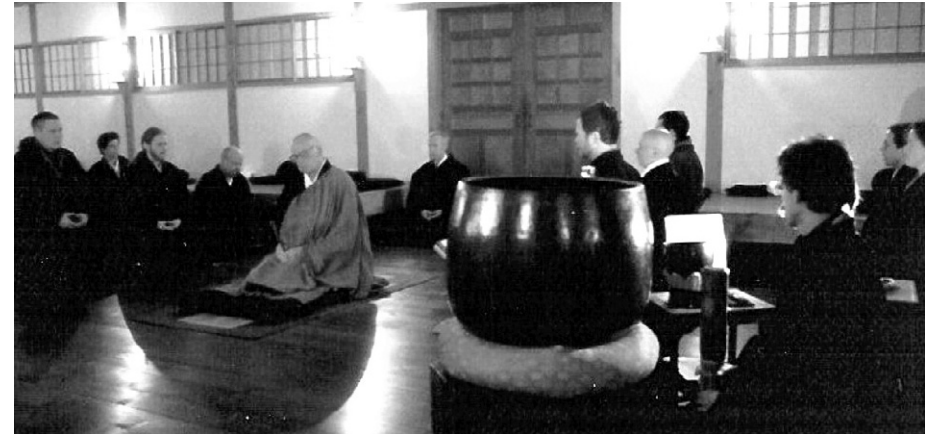
샌프란시스코 젠 센터 법회 모습