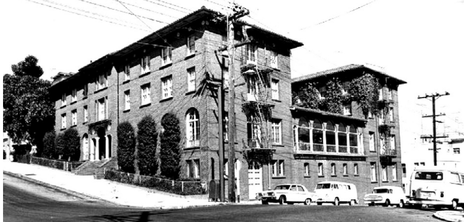
미국의 유명한 건축가 줄리아 모건이 1922년 설계한 역사적인 건물에 자리잡은 샌프란시스코 젠 센터

또한 젠 센터는 오는 8월 중 '네 번째 수행처(fourth practice site)'로서 새로운 웹사이트를 오픈하고, 부처님 가르침과 젠 센터의 수행 프로그램을 담은 비디오 오디오 파일을 전문적으로 제공할 계획이다. 오디오 파일에는 젠 센터를 세운 로시 스님의 저술 <Zen Mind, Beginner's Mind> 등도 게재된다.