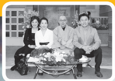
아침마당 출연 장면

● 도서출판 운주사 · 서울특별시 서북구 동소문동 4가 270번지 성심빌딩 3층 ● 전화 (02) 926-8361 팩스 0505-115-8361 ● 주문 (02) 3672-7181 ● 다음카페: 도서출판 운주사 www.cafe.daum.net/unjubooks