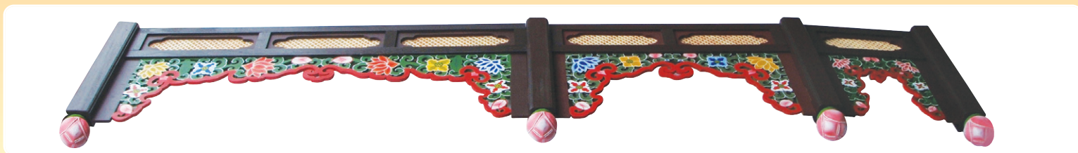
대웅전, 산신각, 포교당, 소법당 등의 천장에 누구나 간편하게 직접 조립할 수 있게 제작

전통적인 연꽃 단청과 문창살문양으로 부처님을 모시는 법당을 보다 장엄하게 설치하도록 제작하였습니다.