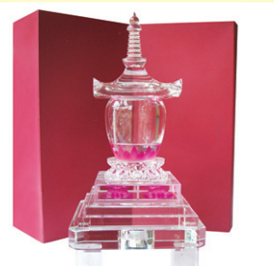
크리스탈사리탑 높이 45cm 가로, 세로 20cm 가격 35만원