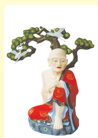
■ 독성나만존자 높이 74cm 재질 : 마블(특수물) 가격 50만원