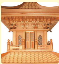
3층 목각탑 높이 85cm 가로, 세로 35cm 가격 50만원