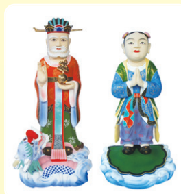
■ 해상용왕 높이 82cm 문수동자 높이 70cm (천수천안, 관세음보살 좌우협시분) 재질 : 마블(특수물) 가격 70만원 (해상용왕, 문수동자 1set)