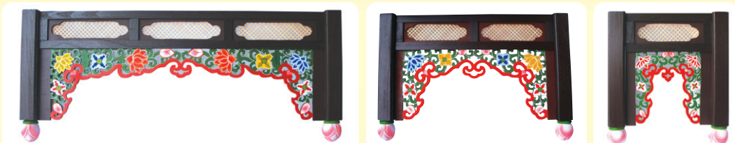
3자 : 1판 2자 : 4판 1자 : 4판