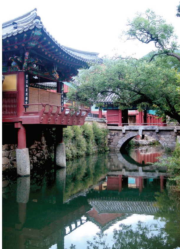
송광사 계담의 영지효과