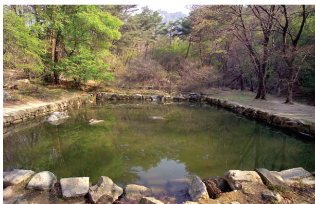
청평사 영지에 비친 산봉우리와 주변의 자연