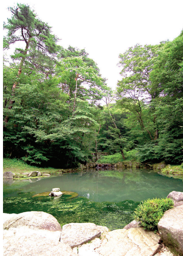
해인사 영지. ‘영지’ 라고 새긴 자연석 표지판이 있었다.