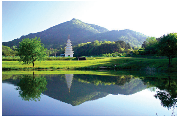
미륵사 전면 영지에 비친 탑과 산봉우리