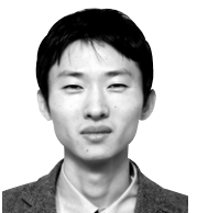
주성원의 기초 교리 <5>