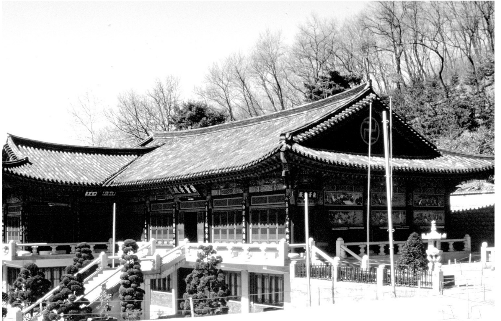
백련사는 광해군의 형 임해군에 의해 큰 경제적 부담을 지기도 했으나 왕실의 태실을 둔 뒤 다시 기도처가 되었다.

백련사는 의숙공주의 제사를 지내면서 크게 중창되었다. 명종 1년(1546) 1월 6일 사헌부에서 유생들의 정거에 대한 철회를 청하는 대화 속에 "정도사는 다른 사찰에 비할 것이 아니다. 조종으로부터 공주를 위해 창립하여 제사 지낼 장소로 삼고 승려로 하여금 수호하게 한 것이다"라는 내용이 나오기 때문이다.