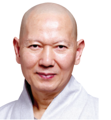
동국대 선학과 교수