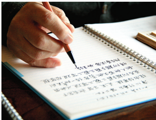
"붓끝에 마음을 모아 사경을 하면 하루가 정리되고 내일을 위한 새 힘이 생긴다"고 송 위원장은 말한다.

"실천이 중요합니다. 아무리 좋은 계획도 실천이 없으면 한 발자국도 나갈 수 없습니다. 무슨 일인데