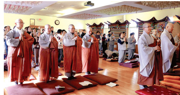
조계종 해외 교구 동부지역 교구본사 불광선원 일요법회에 연수중인 국제불교학교 학인스님들이 참석했다.