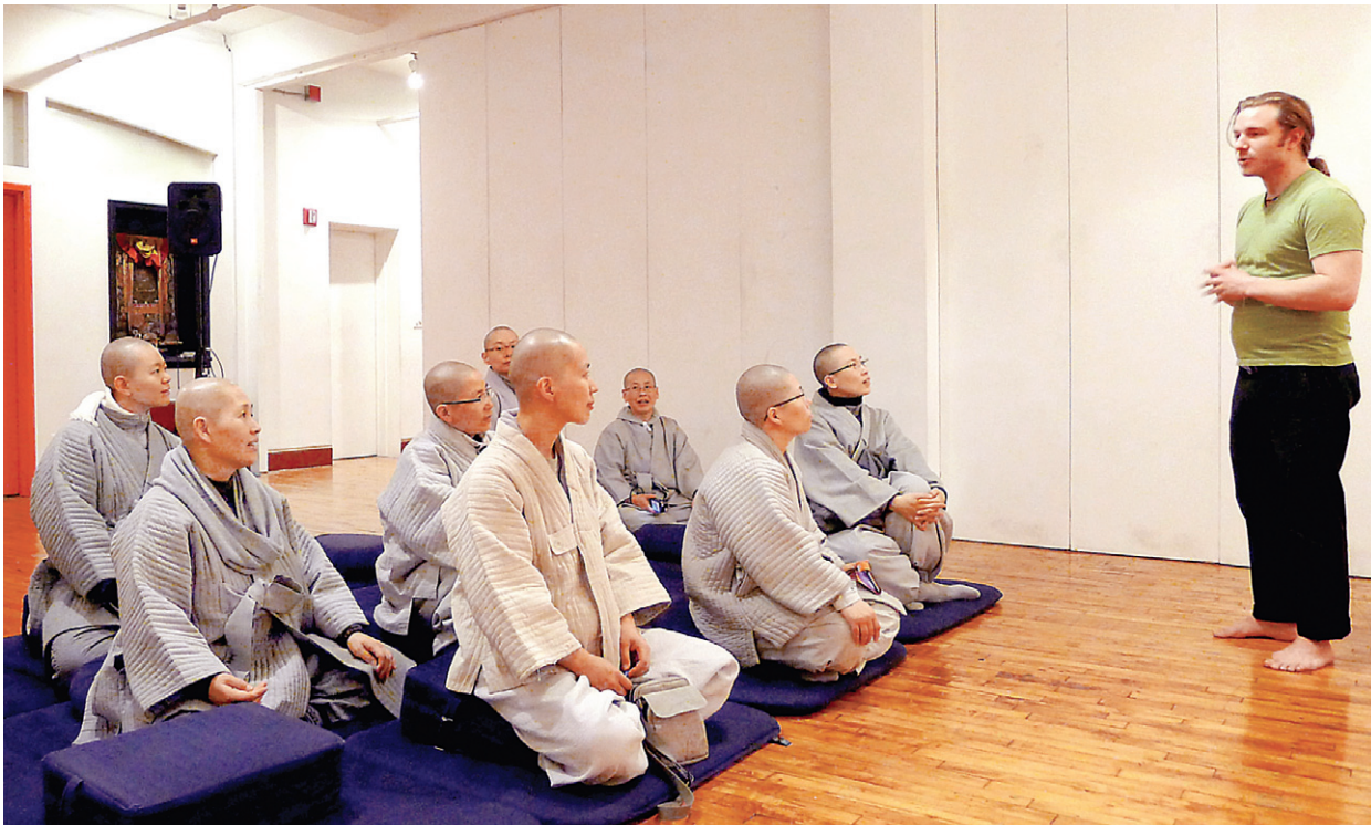
조계종 국제불교학교 1기생 9명의 비구니 스님들이 뉴욕 샴발라센터를 방문해 심리학자와 대담을 하고있다.

이 사찰은 주미 태국대사를 비롯해 현지 태국 유력인사들이 신도로 활동하고 있다. 태국의 큰 스님들도 매년 수차례에 걸쳐 왓 타이에서 자국인과 미국인을 위한 정기 수행지도에 나선다. 왓 타이에는 스님 6명과 사미니 1명이 있어 사찰행정, 범호운영 등