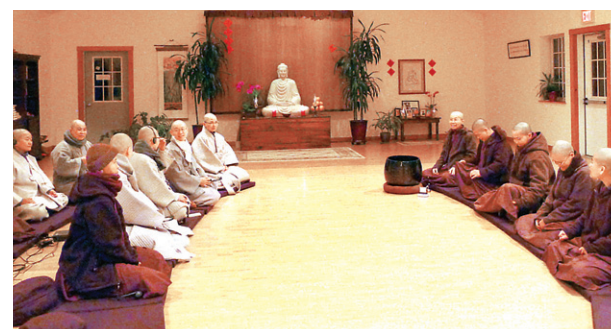
블루클립 사원 스님들과의 만남