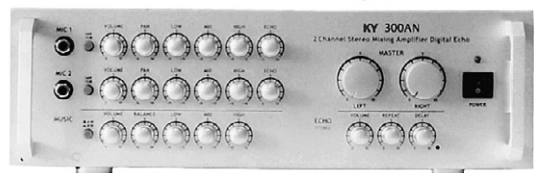
스테레오 앰프 300AN