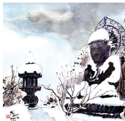
통일대불, 가공캔버스, 수묵혼합채색, 53×45.5cm