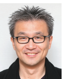
편집국 사진부 차장

아우었고, 바람은 숲을 그리며 건디고 있었다. 고드름이 녹기 시작했다. 겨울바람은 숲으로 돌아 가고 낙수는 미련 없이 찰나를 따라갔다. 무슨 생각을 그리 했을까. 낙수와 낙수 사이에서 겨울 햇살은 어쩔 수 없었다. 한 생각이 될 수밖에. 사라지는 찰나와 찰나 사이에서 겨울 햇살은 어쩔 수 없었다. 바람의 뒷모습을 바라볼 수밖에. 무슨 생각을 그리 했을까. 꽃이 피는 날? 따뜻해진 세소리? 곧 봄이 올 것 같다.