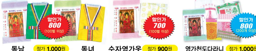
동남 할인가 800 (100매 이상) 정가 1,000원