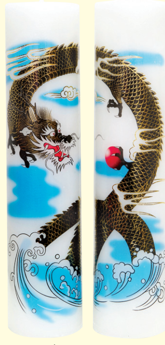
크기 7.5 x 29cm