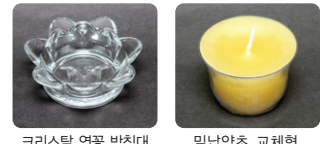
크리스탈 연꽃 받침대 밑받침 초 교체형