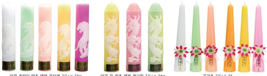
아름 호랑이 양초 연봉 돈다래 7.0 x 34cm