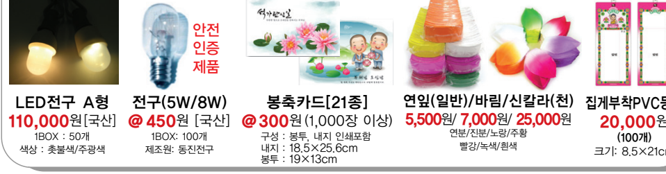
LED전구 A형 110,000원(국산)

23cm / 25cm / 30cm / 50cm 1m / 2m 5종이상 @ 65,000원 기타주문생선