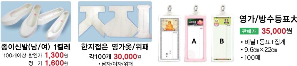
종이신발(남/여) 1켤레 100개이상 할인가 1,300원 정가 1,600원