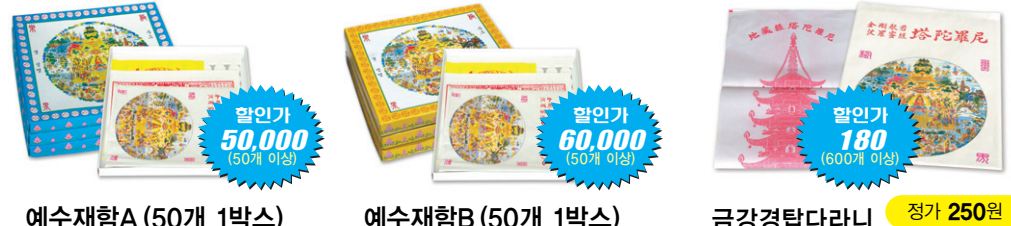
예수재함A (50개 1박스) 할인가 50,000 (50개 이상)