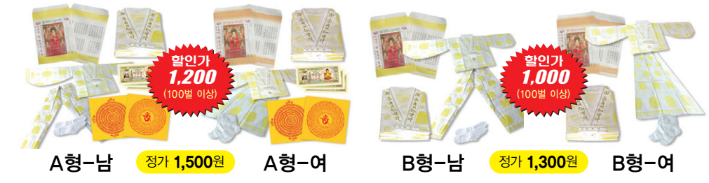
A형-남 정가 1,500원