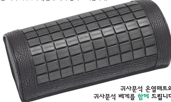
귀사문석 온열매트와 귀사문석 베개를 함께 드립니다.

귀사문석 온열매트에서는 93%이상 방출되는 원적외선이 우리몸의 피부속으로 50mm까지 침투하여 혈액순환을 촉진시켜 준다. 그리고 피하상층의 온도상승, 미세혈관의 확장, 신진대사의 강화, 부인병, 신경계 질병, 노인성질환, 어깨결림, 허리통증완화, 장속의 노폐물, 중금속 배출등에 탁월한 효과가 인정되고 있다. 또한 현대생활 주책이 시멘트 구조로 되어있어 자연적으로 지기(地氣)를 차단하여 각종 질병의 원인이 되고 있으나 귀사문석은 천연의 강력한 기(氣) 방사체이므로 자연적으로 신체에 활력이 되어준다. 귀사문석은 항균효과 86%, 항균력이 억제력은 거의 100%이며, 냄새 제거 능력도 탁월하다.