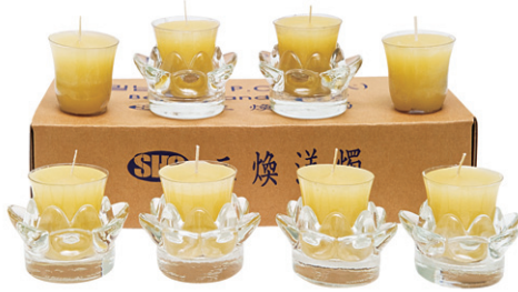
상생화재 생산물 화재 배상 책임보험 1억원 가입