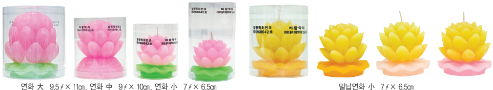
연화 대 0.5 x 11cm, 연화 중 9 x 10cm, 연화 소 7 x 6.5cm