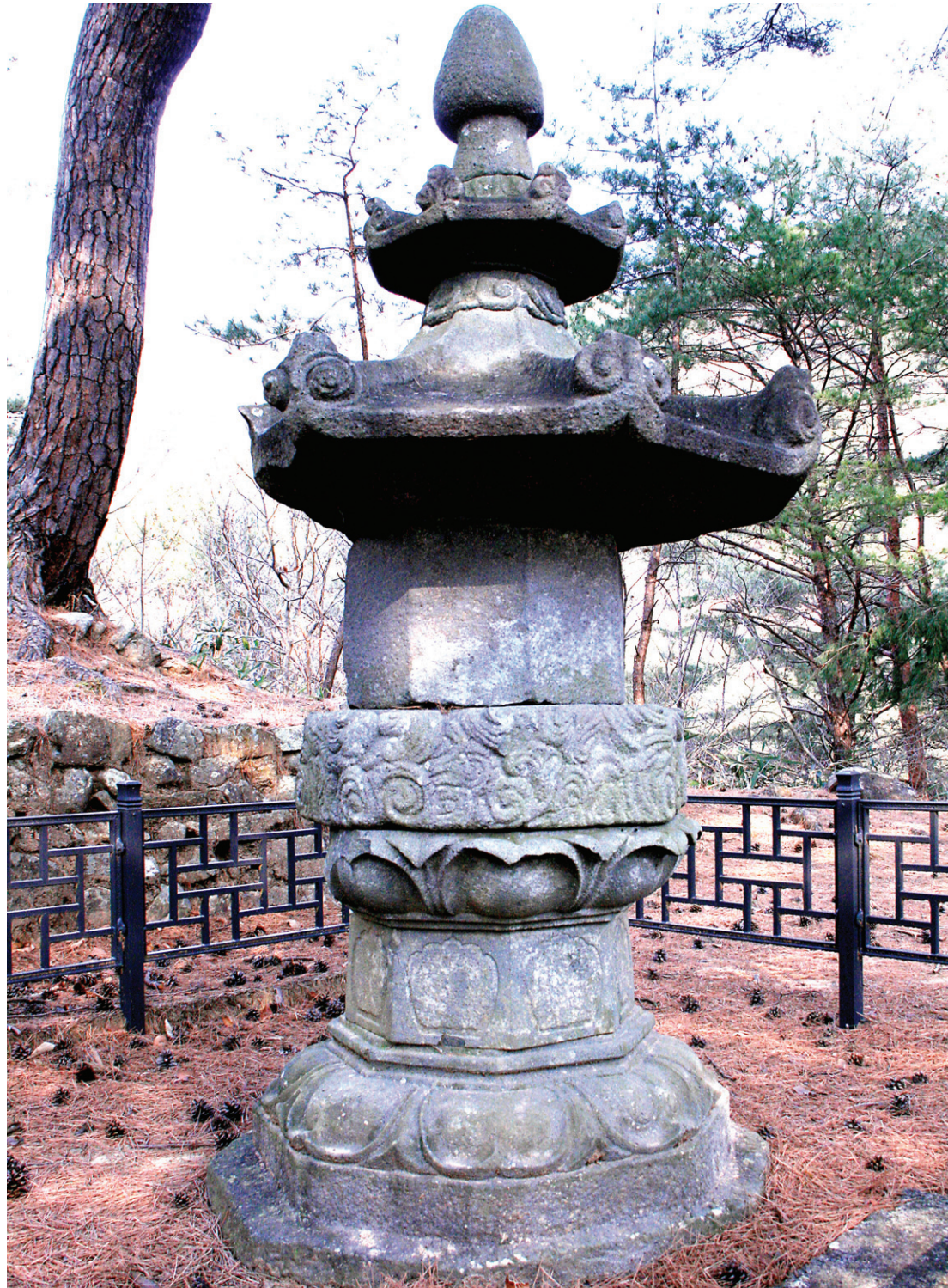
쌍계사 뒤 오두봉 꼭대기에서 있는 진감선사의 부도

진감선사는 문성왕 12년(850)에 입적했습니다. 문인들을 불러 놓고 "나는 이제 가려한다. 너희들은 일심으로 근본을 삼아 힘써 노력하라. 탑을 만들어 형상을 보존하지 말고 명(銘)으로써 행적을 기록하지도 말라"고 당부했습니다. 때문에 그의 제자후는 난감했습니다. 존경하는 스승을 흠모하는 마음을 어찌 표현하지 말라고 하시는가? 그러나 스승의 지엄한