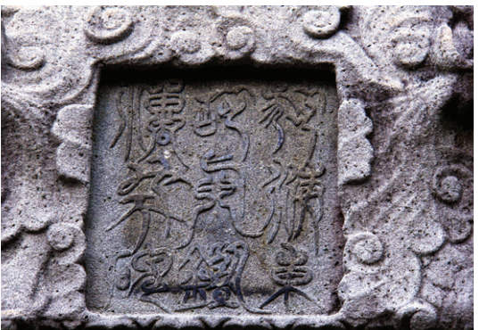
진감선사 대공영탑의 이수 중앙에 선명한 전액

쌍계사 대웅전 아래 홀로 서 있는 '진감선사대공영탑비문(眞鑑禪師大空靈塔碑文)'의 후반부에 있는 내용입니다. 우리 역사에 있어 깊은 학문과 결출한 문장으로 따를 자가 없는 고운 최치원이 찬했습니다. 쌍계사가 '옥천사'라는 이름으로 장건된 것은 진감선사(774-850) 이전의 일이지만, 중국으로 건너가 조계선종의 적손이 되어 귀국한 진감선사에 이르러 쌍계사는 크게 확장되었습니다. 정강왕이 절 이름을 직접 지어 준 것은 진감선사에 대한 존경심의 표시