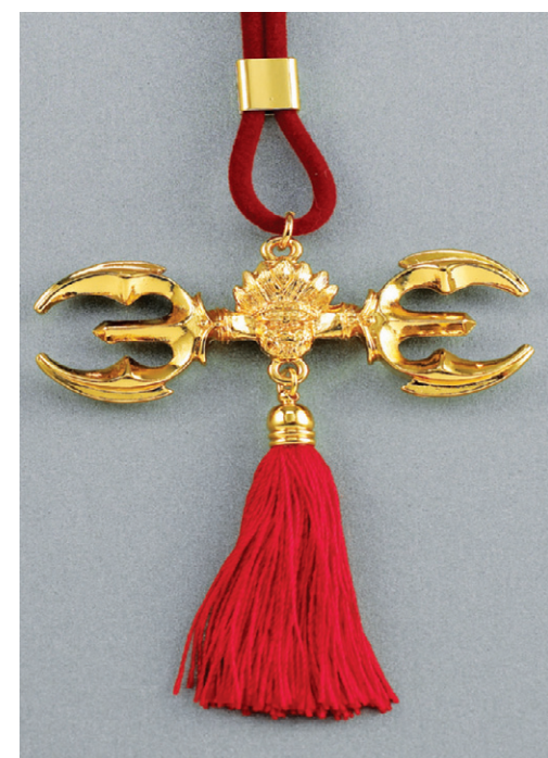
부처님 제1의 비방법구

경기가 너무 없어, 장사가 너무 안되, 문을 닫아야겠어, 요즘 사업을 하는 중생들의 푸념이다. 반면 목도 안좋고 불경기에도 흥왕을 누리는 점포와 사업장도 많다. 부자가 되는 터가 있고, 패망하는 터가 있고, 그리고 항상 겨우겨우 먹고사는 터가 있다. 한 건물 한지붕 밑에서도 좋은터가 있어 사업이 잘되고 장사가 흥왕하는 것을 볼 수 있다. 장사가 안되는