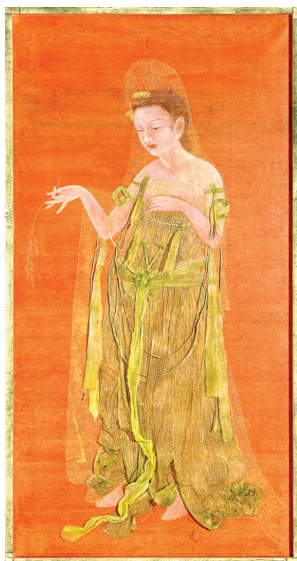
수월관음도, 지장보살, 아미타여래의 모습을 띤 오색 보살(96×196cm 한지, 안료, 염료)

오방색 물결 옆 한쪽 벽면에는 수월관음, 아미타여래, 지장보살 등 고려 불화 도상에 한국 여성의 얼굴을 결합시킨 ‘오색보살’ 시리즈가 걸려있다.