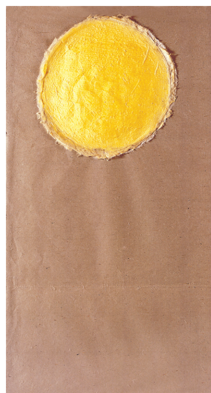
CATM 갤러리에 전시돼 판매된 ‘만고불변’(2008, 파고지에 자연물감)

구경광대다라니경) 등 국보급 영인지 제작에도 참여했으며 2007년 경북 청도에 영담한지미술관을 개관해 운영하고 있다. 영담 스님은 청도에 영담한지미술관을 운영하며 어린이한지미술대회를 개최하는 등 한지문화 활성화에 앞장서 왔다. 스님은 옛 스님들이 닥나무에 향수를 주어 기르면서까지 종이를 만들어서 정성을 다해 사경(寫經)하고 불화(佛畵)를 그리며 종이문화를 발전시켰던 정신을 이어 수행과 작품 활동을 겸하고 있다.