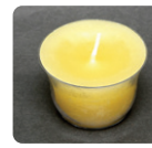
크리스탈 연꽃 받침대