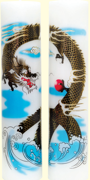
크기 7.5 x 29cm