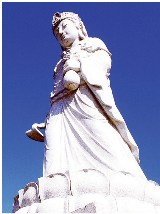
봉화 정도원 호미 든 관음상

특히, 88올림픽 때에는 기획홍보실장을 맡아 불교 문화 콘텐츠인 유등을 이용해 10만 유등 문화행사를 열기도 했다.