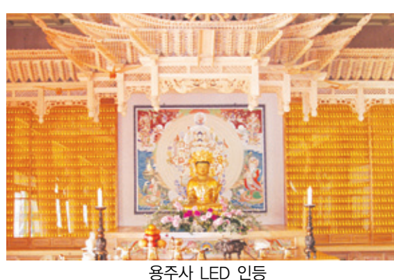
용주사 LED 인등