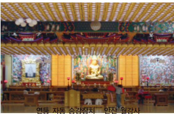
연등 자동 승강장치 - 안산 월경사