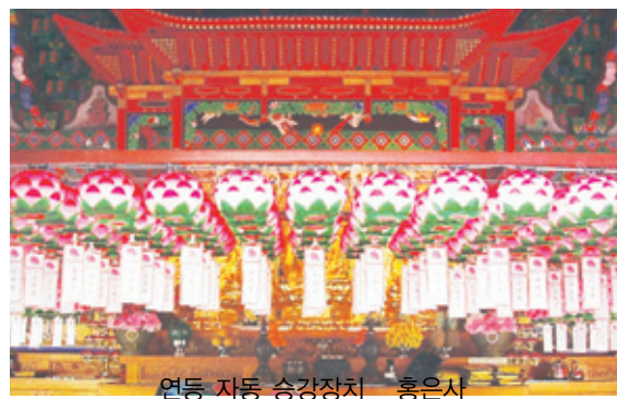
연등 자동 승강장치 - 흥은사